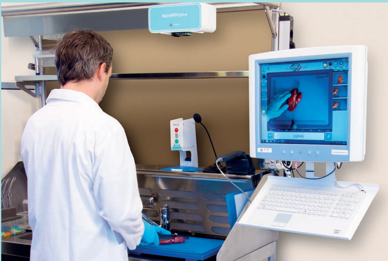
MacroPATH - Macro digital imaging system for the grossing room

¡Se parte del grupo y eleva el nivel de tu laboratorio a Digital!